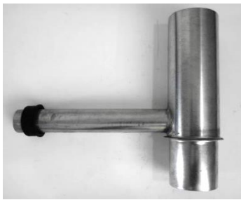
vulautomaatje met ro-ring aansluiting voor houten regenton