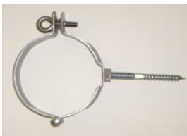
beugel met moer en draadpen