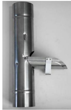
regenwaterklep met handvat